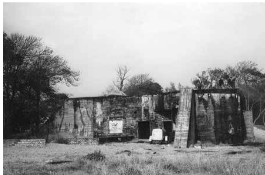
De sloop van de telefoonbunker in de jaren 60 was een enorme klus. In het dak werden gaten geboord om explosieven te plaatsen

Op het landgoed lag een belangrijk knooppunt van het Duitse Festungskabelnetz ; het militaire telefoonnet. Er werd daarom een zware betonnen bunker gebouwd waar vanuit de communicatie geregeld kon