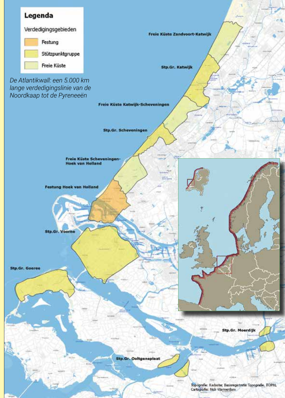
De Atlantikwall: een 5.000 km lange verdedigingslinie van de Noordkaap tot de Pyreneeën