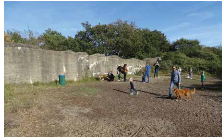
De voormalige tankmuur is nu een populair rustpunt en speelobject dat veel bekijks trekt

Ga bij de Pannenkoekenboerderij LA en steek de N441 (Wassenaarseweg) over. Hier kun je de fiets parkeren en de oranje route linksom voor ongeveer 1 kilometer volgen tot je bij de tankmuur bent.