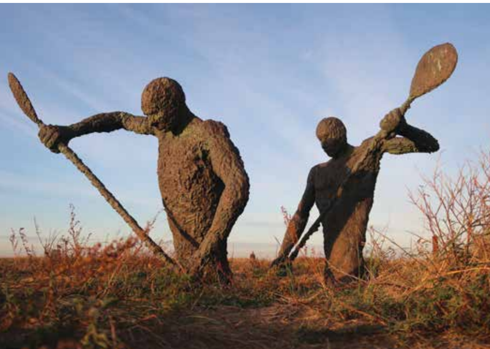
Het Engelandvaardersmonument, twee jonge mannen in een kano symboliseren de Engelandvaarders die vanaf Katwijk de oversteek naar Engeland waagden