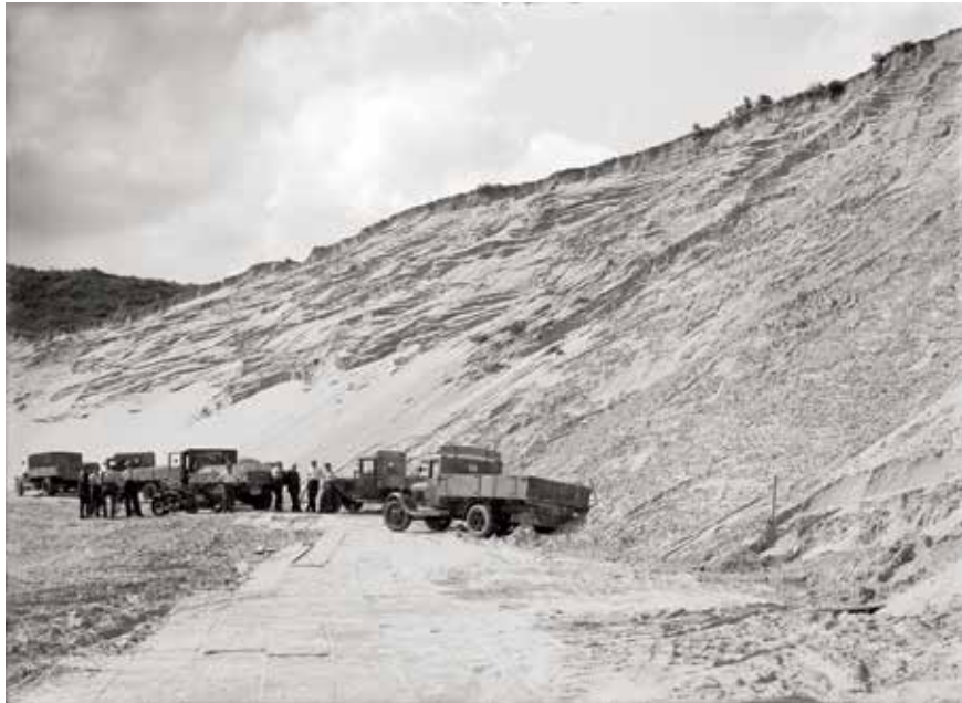
De afgravingen bij De Klip gingen nog tot in de 20ste eeuw door, zoals deze foto uit 1933 laat zien

De hoogte en de steile duinhelling boden ideale omstandigheden voor het aanleggen van een observatiepost en hoofdkwartier. Vanuit de observatiebunker hadden de Duitse waarnemers wijds zicht over het vlakke land tot aan de duinen. De bunkers op De Klip liggen nu onder het zand en zijn niet meer zichtbaar.