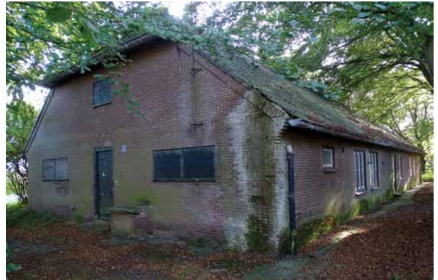
Een vervallen en overwoekerde manschappenbarak. Eerst gebruikt door de Duitse Luftwaffe, later door de Nederlandse Marine Luchtvaartdienst

architectuur van de Heimatschutzstil . De boerderijstijl was in harmonie met het landelijke karakter van het omliggende gebied en bood een goede camouflage. Door de spreiding van de gebouwen leek het vanuit de lucht op een dorpje.