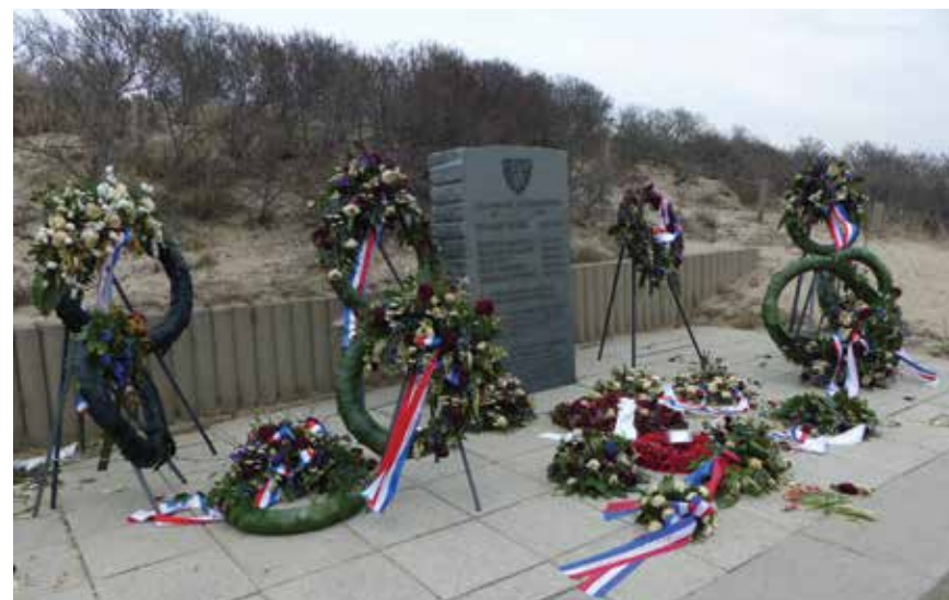
De natuurstenen gedenksteen na een kranslegging. Elk jaar vindt er een ceremonie plaats waarbij verschillende delegaties aanwezig zijn

Aan de strandopgang ligt een monument voor de omgekomen Franse soldaten. Elk jaar vindt hier nog een herdenking plaats.