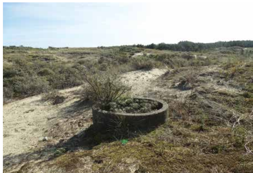
Boven op het duin vormde dit Deckungsloch een perfecte schutterspositie