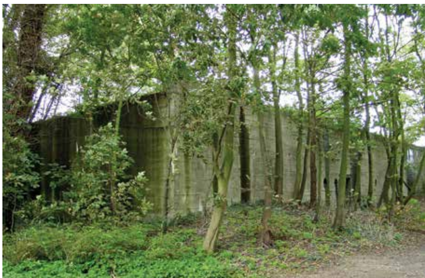
In het hoofdkwartier was ook een hospitaalbunker gebouwd. Het was de laatste bunker van het complex die in 2007 werd gesloopt