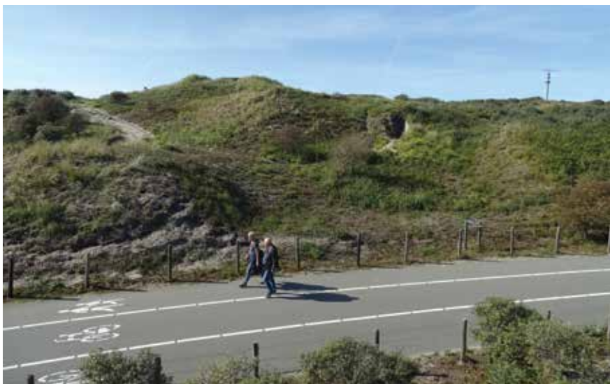
Op het hoogste punt van het duin is nog net een gedeelte van het dak van de observatiepost zichtbaar

manschappenonderkomens, opslagplaatsen en geschutsbunkers met elkaar verbond. Paviljoen 'De Badmeester' is gebouwd bovenop een van de betonnen geschutsbunkers. Staatsbosbeheer heeft het complex in beheer en organiseert rondleidingen onder begeleiding van een gids.