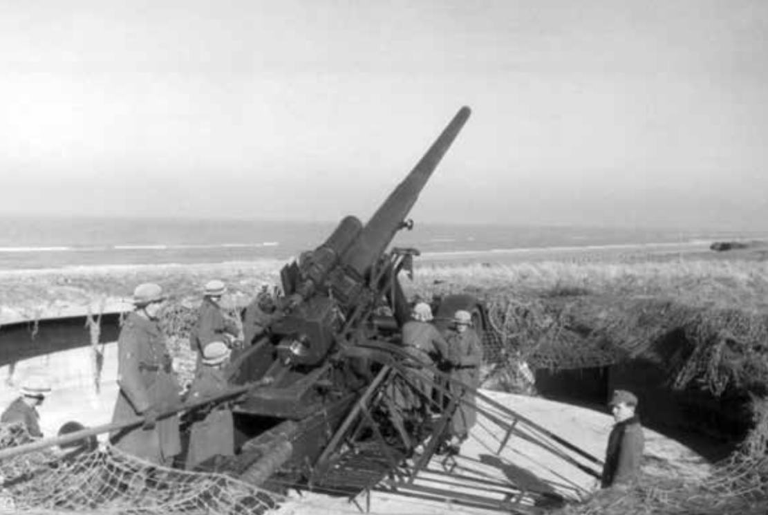
Kanon in een van de open beddingen van de batterij Katwijk Alt met zicht op zee